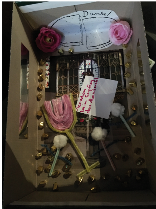
Das Abendmahl im Schuhkarton – entstanden auf der Konfirmandenfreizeit.

Selbstverständlich wird man in der Jugendlounge meistens mit Essen versorgt!